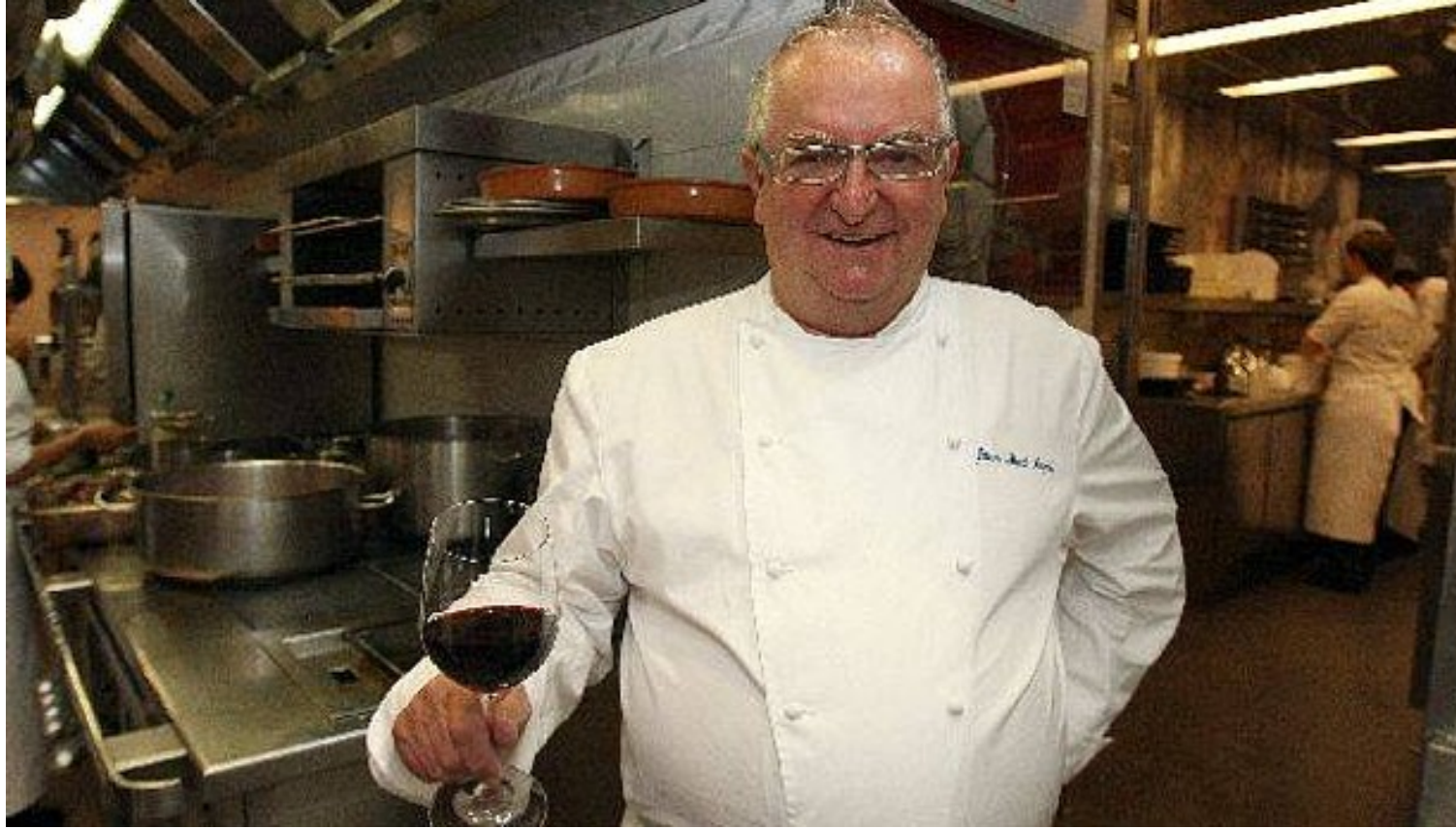
Juan Mari Arzak

DONOSTIA. El restaurante Arzak de Donostia ha sido reconocido como "mejor restaurante moderno del mundo" por los lectores de la prestigiosa revista gastronómica neoyorquina Saveur.