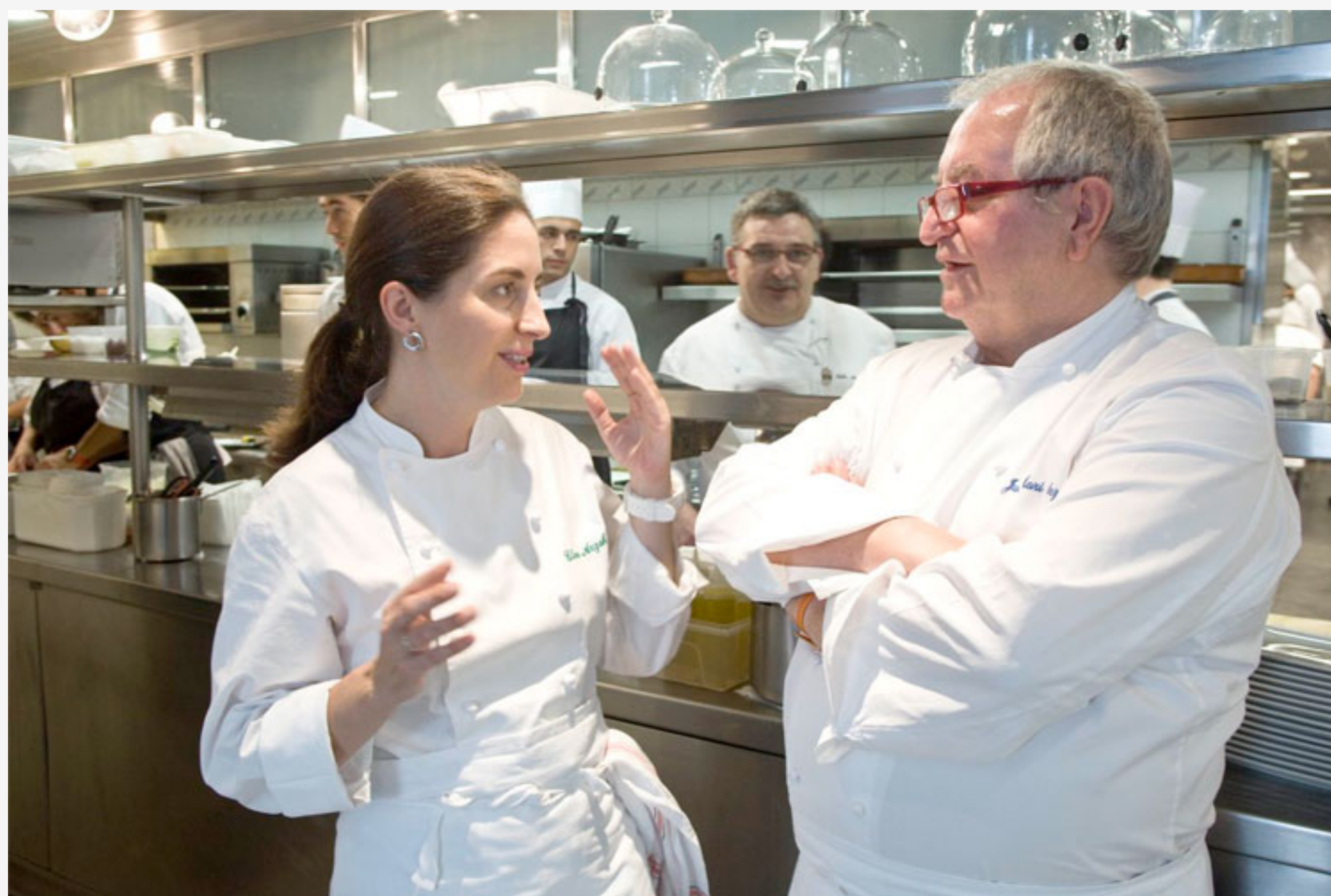
ELENA & JUAN MARI ARZAK.

Éste es el caso de Juan Mari Arzak , un referente de la gastronomía mundial. Arzak es uno de los padres del movimiento culinario conocido como Nueva Cocina Vasca, que surgió en España en la década de 1970 siguiendo la estela de la entonces floreciente Nouvelle Cuisine francesa. La Nueva Cocina Vasca, que sobresale por la variedad y riqueza de sus productos, toma como base el valioso y variado recetario popular del País Vasco.