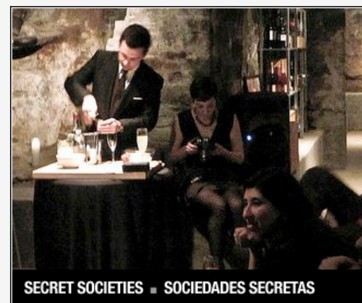
SECRET SOCIETIES ■ SOCIEDADES SECRETAS