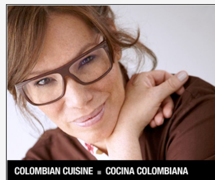
COLOMBIAN CUISINE ■ COCINA COLOMBIANA