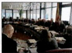
Reunió de cònsols ahir a Canillo.