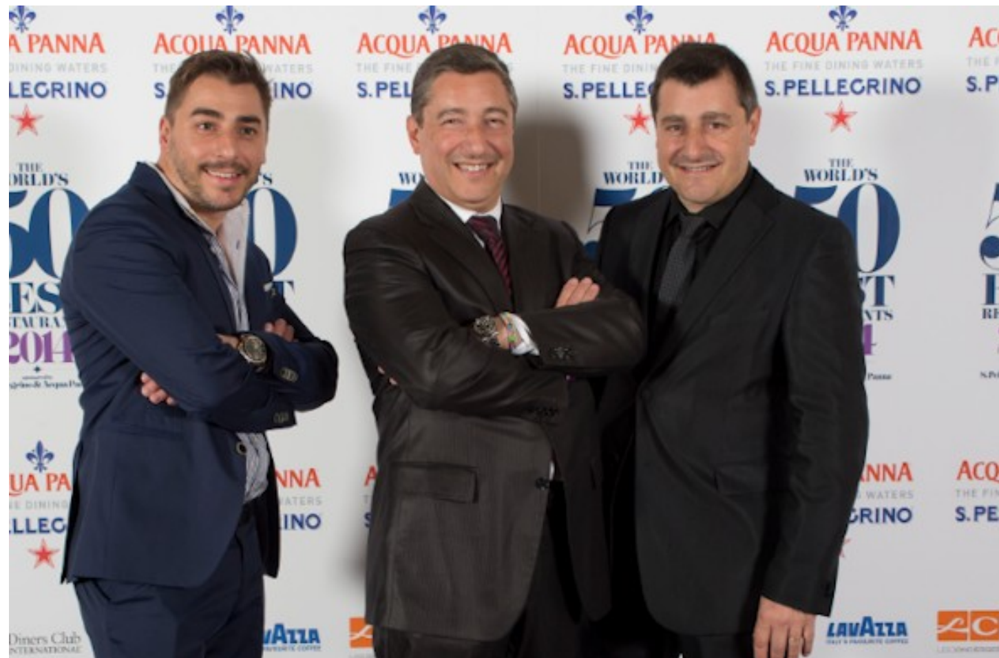
Jordi, Joan y Josep Roca de El Celler de Can Roca, Segundo Mejor Restaurante del Mundo 2014

Apenas 24 horas después de conocer los resultados de la clasificación de la revista británica Restaurant, The World's 50 Best Restaurants ( www.theworlds50best... ), España celebra que tiene 7 restaurantes entre los 50 mejores del mundo (2 más que el año pasado).