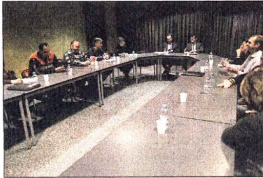
Un moment de la reunió d'ahir entre l'executiu i els representants sindicals.

Segons Ubach, els sindicats es mantenen "ferms" en la seva posició d'obtenir contraprestacions a la reducció del complement de jubilació que el Govern els planteja. Així, va assegurar que "davant d'una pèrdua econòmica que el Govern ens demana sobre les jubilacions i les prejubilacions ha d'haver-hi unes contraprestacions socials i laborals", com poden ser amb menys ho-